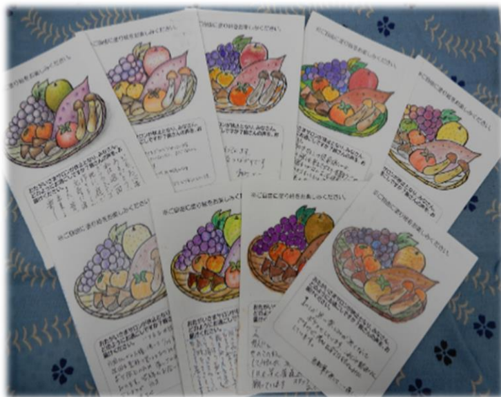
▲参加者からのお便り