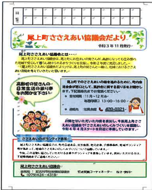
▲ささえあい協議会だより