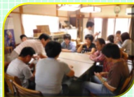
▲今日はみんなでトランプのババ抜き

活動日：毎週火曜日 13:00~14:30 活動場所：浜の宮工房(加古川市尾上町口里 548-6) 問合せ：加古川市ボランティアセンター 079(424)4318