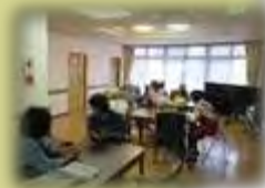
↑話し相手ボランティア 「だんらん」 高齢者と楽しく話し相手