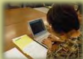
↑点訳ボランティア 「東公せせらぎ」 パソコンでの点訳体験