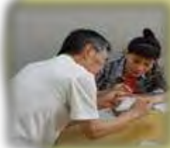
↑点訳ボランティア 「てんとうむし」 点字盤を使用して点字体験