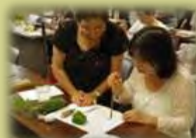
↑絵手紙ボランティア 「はとぼっぼ」 絵手紙の描き方を体験