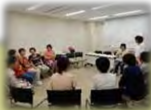
↑手話・要約筆記ボランティア 「いいとも」 手話学習