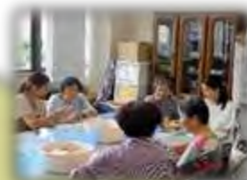
↑収集ボランティア 「ぼすと」 使用済み切手の整理