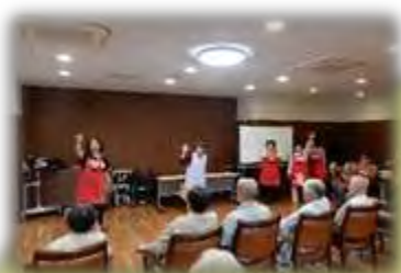
↑レクリエーションボランティア「じゃんけんぽん」 デイサービスでのレクリエーション