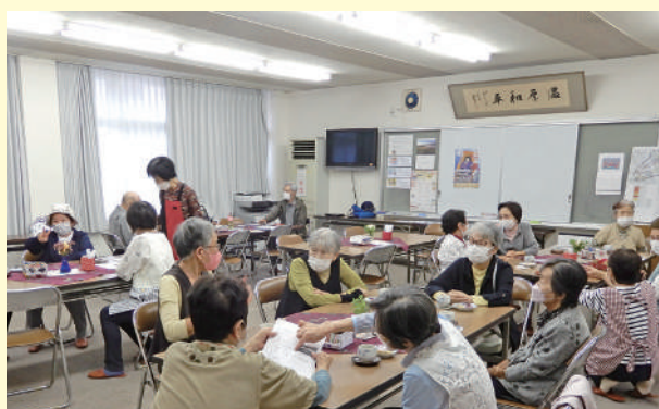
▲おしゃべりを楽しむ様子

このように協議会における意見交換の過程を通して、1つの取り組みがさまざまな形となり、住民同士のささえあい活動が広がっていきます。社協には、各地区担当の生活支援コーディネーターがいますので、地域活動で気になることがありましたら、お気軽にご相談ください。