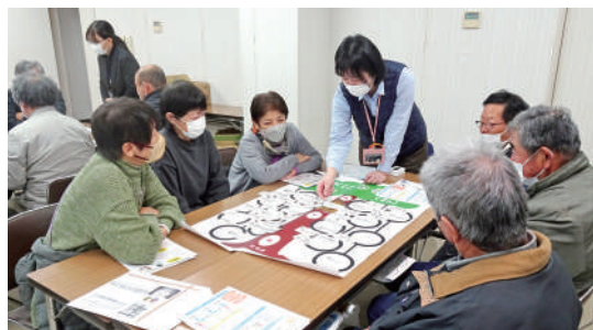
▲志方町見守り研修会の様子

市内中学校区エリアごとに町内会連合会や地区民生児童委員協議会をはじめ、地域の福祉施設や民間事業所、ボランティアなどが参画する協議体(ささえあい協議会)を設置し、住民主体のささえあいのまちづくりを推進します。