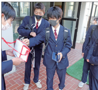
▲加古川南高校の様子