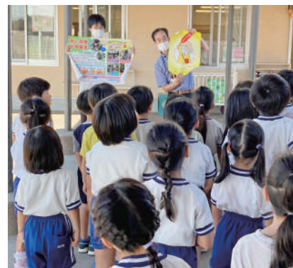
▲学校募金依頼時の様子