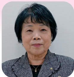
加古川市人権擁護委員協議会会長 加古川市社会福祉協議会 理事

結びに、新しい年が皆さまにとりまして、希望に満ちた一年となりますようご祈念申し上げまして、年頭のごあいさつとさせていただきます。