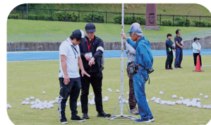
青葉会(ばんたん親善運動会運営サポート)