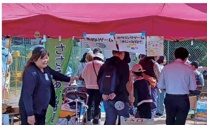
秋風交流フェスティバルでの様子

町内には多くの介護保険事業所があるという強みを生かし、令和4年度に「別府町事業所ネットワーク」を立ち上げました。この取り組みは、事業所の職員同士がつながりを持ち、地域住民との交流を通じて、顔の見える関係づくりを目指しています。