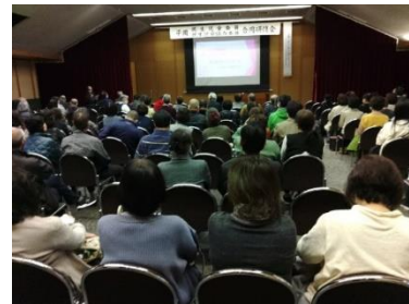
▲合同研修会(民生委員・児童委員と協力委員) 「困り感のある子ども」(令和6年3月23日)